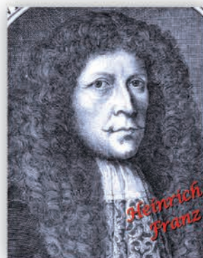
Heinrich Ignaz Franz Biber