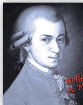
Wolfgang A. Mozart