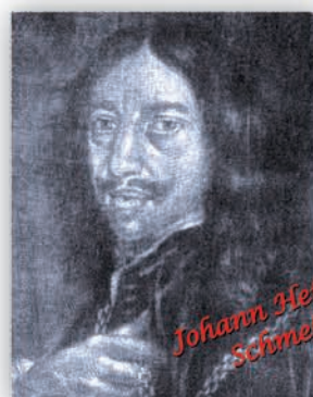
Johann Heinrich Schmelzer